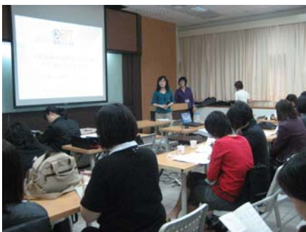
LTTTC 在 2009 英語文教學國際研討會(ETA)舉辦 GEPT 口說評分工作坊

LTTTC除了在台灣各地舉辦教師研習營及評分講習會之外，也誠摯邀請您來到這片園地與我們分享您的問題及心得。請 上網 留下您的意見與問題，我們將在下一期電子報裡回覆。