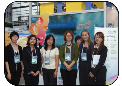
▲ LTTC 代表與臺灣大學袁孝維國際長(左三)、荷蘭萊登大學代表(右二、右三)於 EAIE 現場合影

LTTC 將持續讓國外大學了解 GEPT，希望嘉惠更多計畫出國短期進修、交換學生或攻讀學位的考生。 採認校一覽表