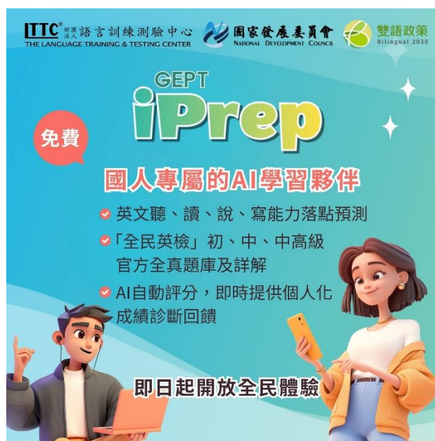
「全民英檢i學網」(GEPT iPrep) 即日起開放全民免費體驗

此外，在上述體驗期間內完成口說或寫作任務者，有機會抽中「全民英檢」報名優惠碼！歡迎上網查詢「全民英檢 i學網」、GEPT iPrep 或至 https://prep.gept.org.tw/ 了解詳情。