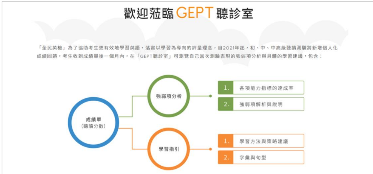
▲附圖 1-「GEPT 聽診室」首頁

幫你優執行長葉丙成教授表示：「閱讀素養不是靠補習，而是有效率不斷的練習，在過程中逐漸養成。這套線上英語閱讀素養課程，可幫助學生養成面對未來生活與職場所需的英語閱讀素養能力。」該線上課程將於 6 月份正式公開，敬請期待。